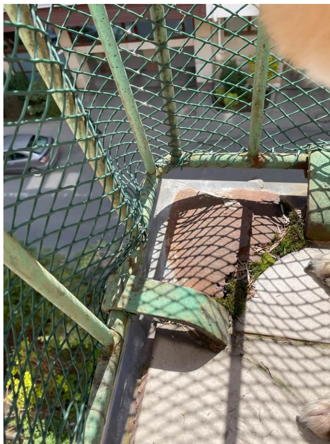
Fot. 6. Widok uszkodzeń obróbki blacharskiej płyt balkonowych.