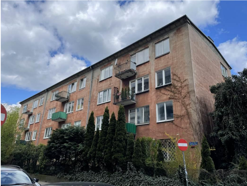
Fot. 1. Widok elewacji od strony południowo-wschodniej.