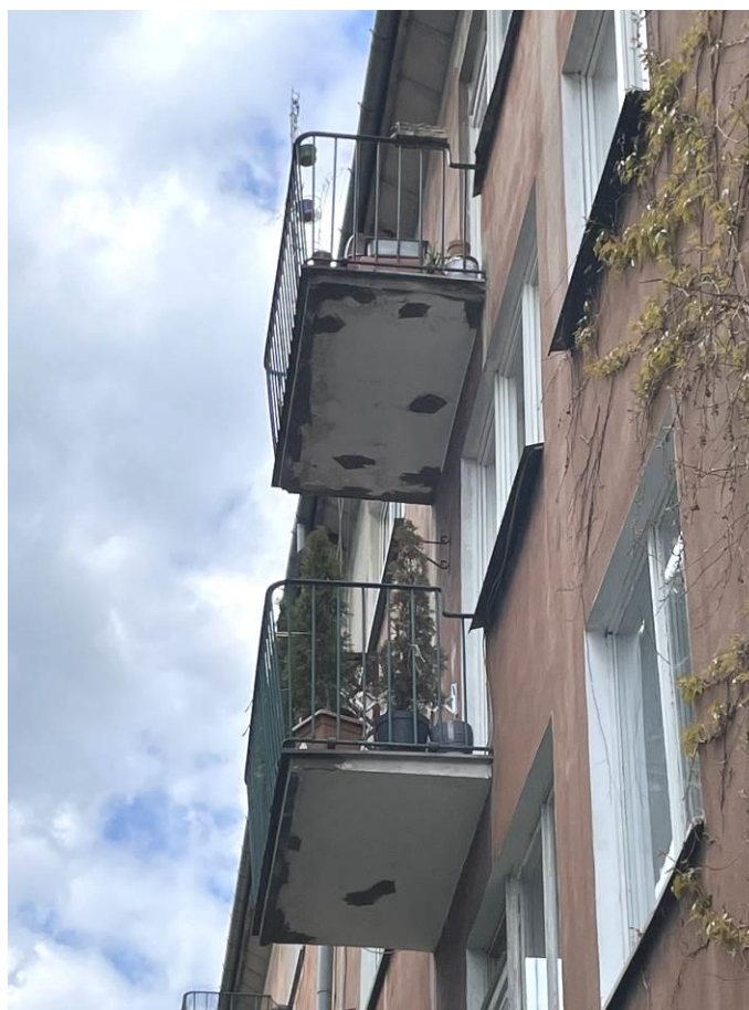
Fot. 3. Widok uszkodzeń płyty balkonowej.

Podczas wizji lokalnej stwierdzono zły stan techniczny balkonów. Widoczne znaczne odspojenia oraz ubytki tynku i otulin, a także łuszczenie się powłok malarskich od czoła oraz od spodu płyt balkonowych. Widoczne zawilgocenie oraz porażenie biologiczne. Miejscami widoczne odsłonięte zbrojenie z oznakami korozji. Obróbki blacharskie uszkodzone mechanicznie, z oznakami korozji, nieszczelne. Balkony zakwalifikowane do generalnego remontu.