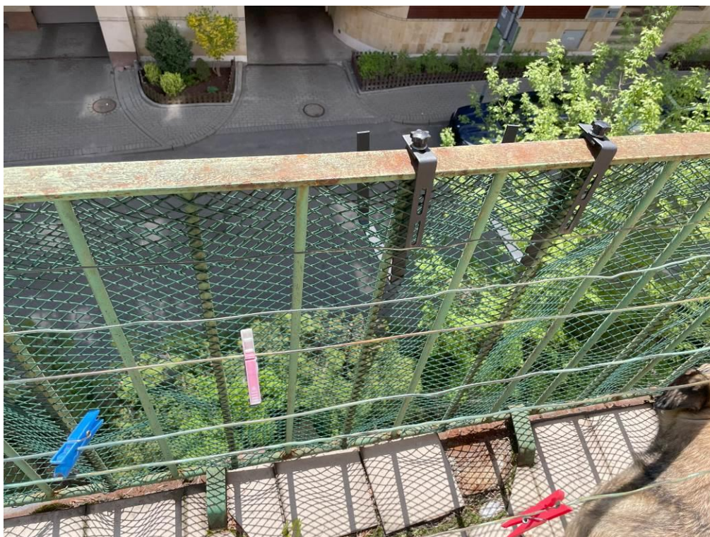
Fot. 5. Widok uszkodzeń balustrady balkonowej.

Ze względu na stan techniczny zaleca się wymianę balustrad balkonowych na nowe, z dostosowaniem wysokości do obowiązujących przepisów.