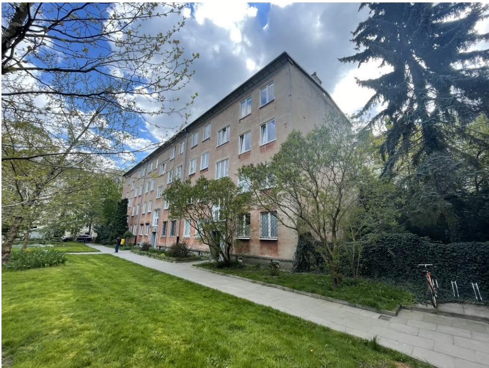
Fot. 2. Widok elewacji od strony północno-zachodniej.