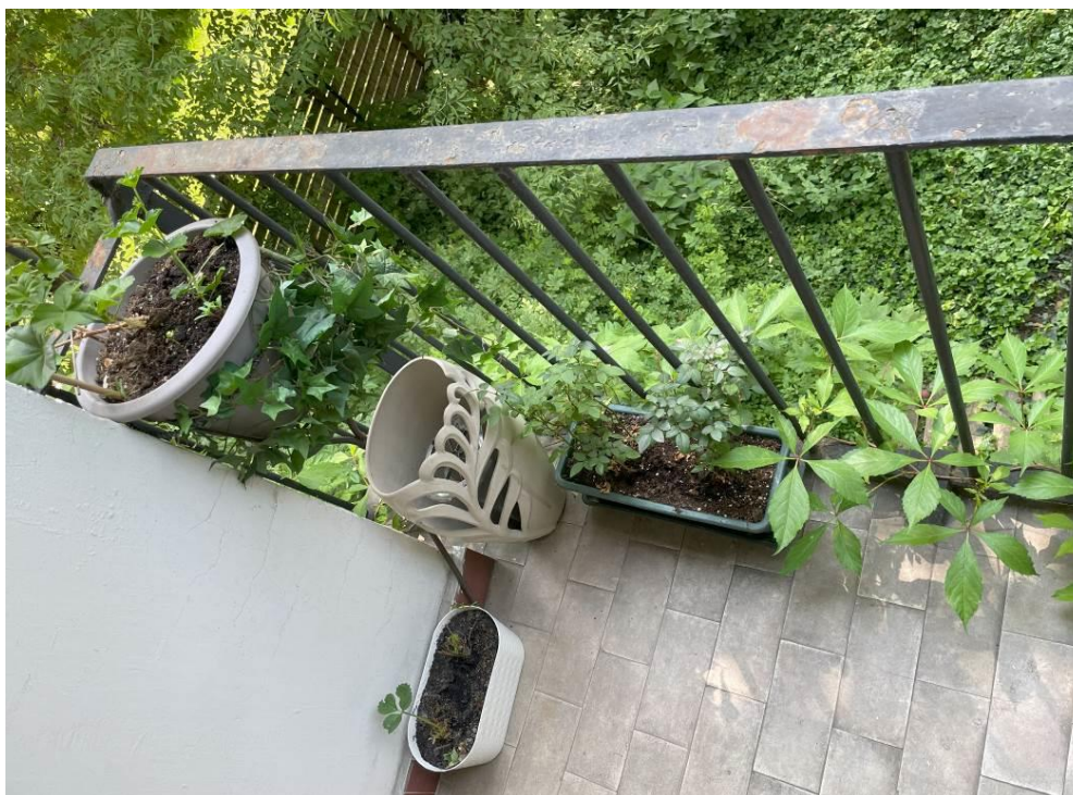
Fot. 5. Widok uszkodzeń balustrady balkonowej.

Ze względu na stan techniczny zaleca się wymianę balustrad balkonowych na nowe, z dostosowaniem wysokości do obowiązujących przepisów.