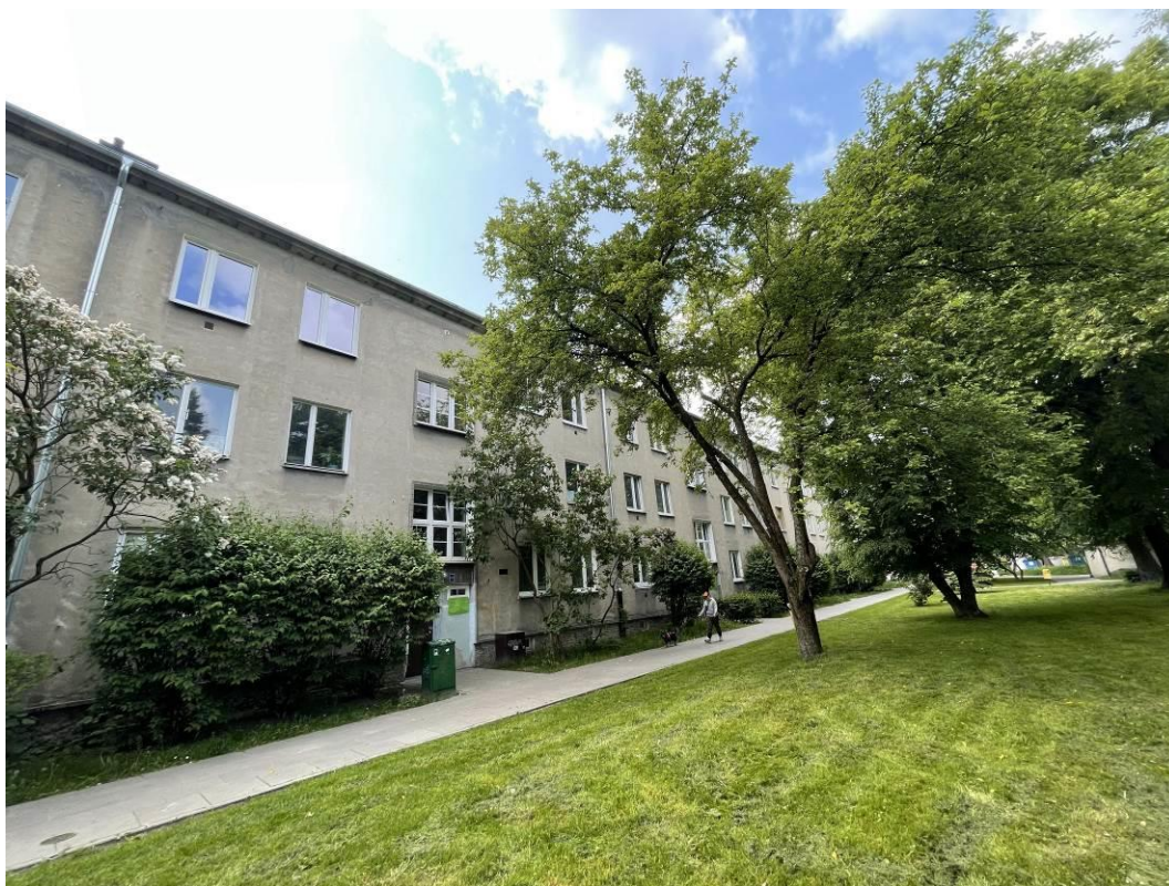
Fot. 1. Widok fragmentu elewacji od strony północno-zachodniej.