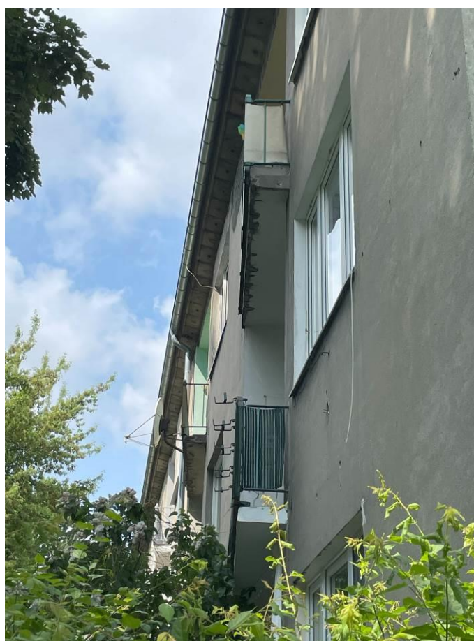
Fot. 2. Widok fragmentu elewacji od strony południowo-wschodniej.