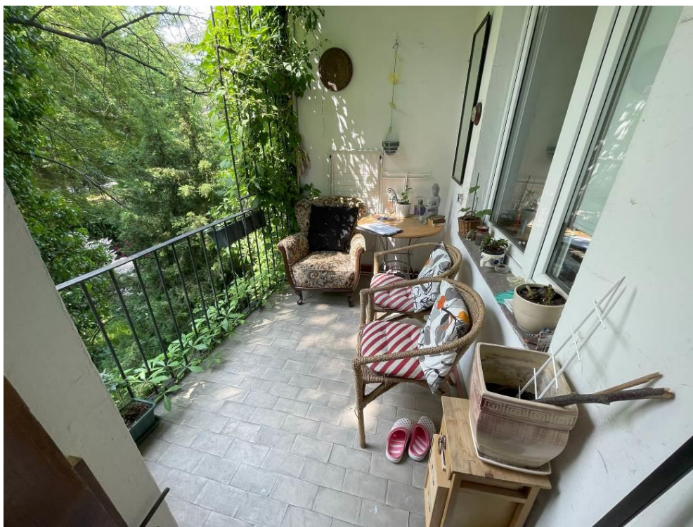
Fot. 4. Widok płyty balkonowej od góry.

Balustrady balkonowe stalowe w złym stanie technicznym. Elementy stalowe znacznie skorodowane, powłoki malarskie w wielu miejscach złuszczone i odparzone. Niewystarczająca wysokość balustrad, wynosząca 88 cm, a także osłabione ich mocowanie stwarza bezpośrednie zagrożenie dla użytkowników.