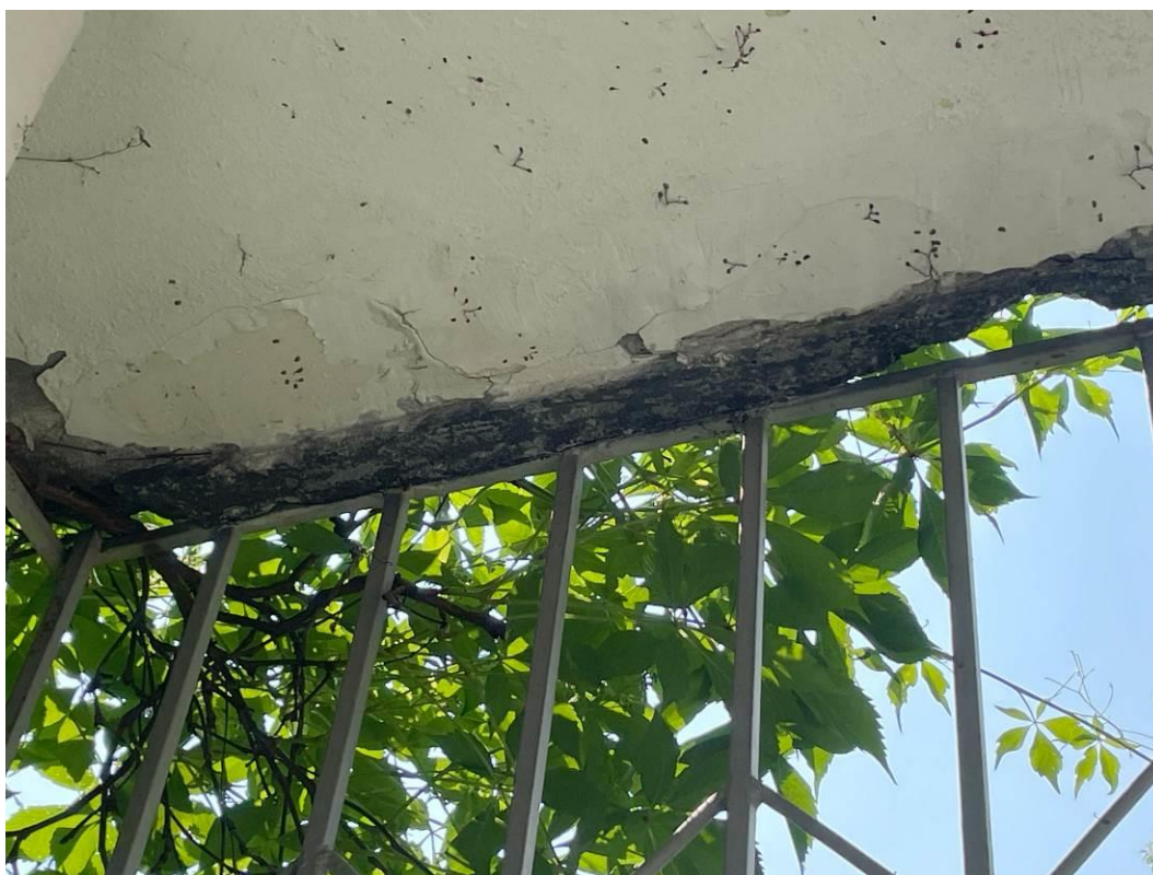
Fot. 3. Widok uszkodzeń płyty balkonowej.

Podczas wizji lokalnej stwierdzono zły stan techniczny balkonów. Widoczne znaczne odspojenia oraz ubytki tynku i otulin, a także łuszczenie się powłok malarskich od czoła oraz od spodu płyt balkonowych. Widoczne zawilgocenie oraz porażenie biologiczne. Miejscami widoczne odsłonięte zbrojenie z oznakami korozji. Obróbki blacharskie uszkodzone mechanicznie, z oznakami korozji, nieszczelne lub ich całkowity brak. Balkony zakwalifikowane do generalnego remontu.